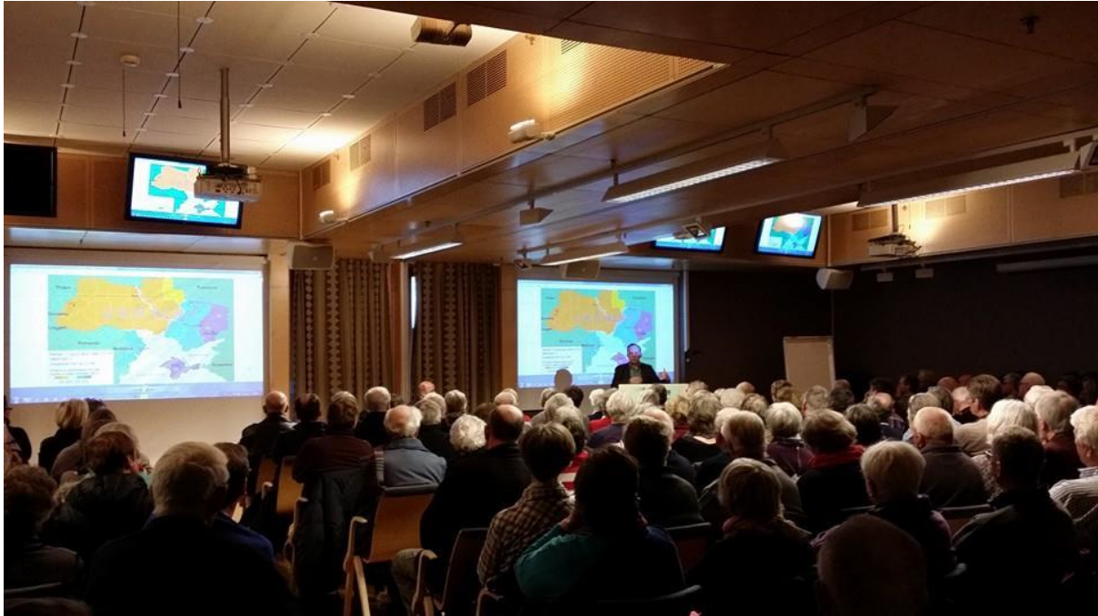
150 personer kom for å høre om konfliktsituasjonen mellom Russland og Ukraina da Folkeakademiet Røros arrangerte folkemøte.

FA Hordaland: «Folk i huset»: I samarbeid med Hordaland Ungdomslag, Hordaland musikkråd og Hordaland fylkesbibliotek vil distriktet bidra til et rikere og mer mangfoldig kulturliv rundt i lokalsamfunnene gjennom å registrere, løfte fram og styrke organisasjonseide hus. Folkeakademiets rolle er å legge til rette for samarbeid og skape mer kultur gjennom økt aktivitet i husene.