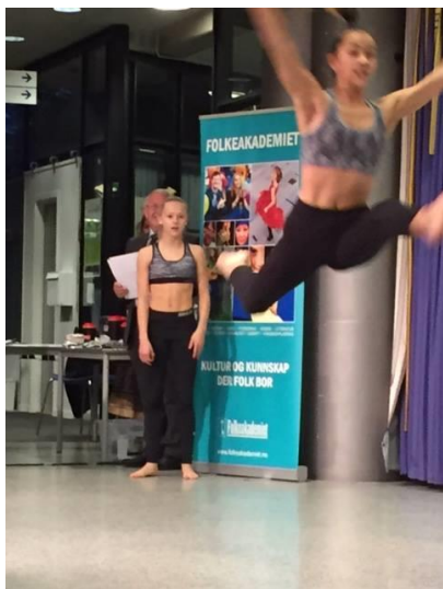
Dans i Folkeakademiet Sandefjord.