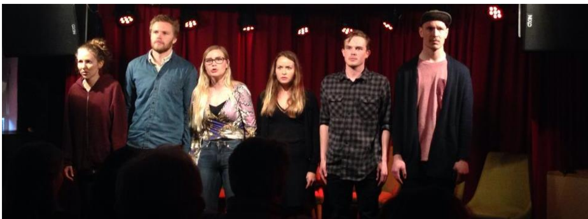
Teaterterroristene med forestillingen Buy Nothing Day i Kverulantkatedralen, Stavanger. Arrangert av Folkeakademiet Rogaland.

Landsforbundets prioriterte temaer har egne nettsider med informasjon, tips etc. FAL lager informasjonsmateriell, klistremerker, plakater, brosjyrer med mere.