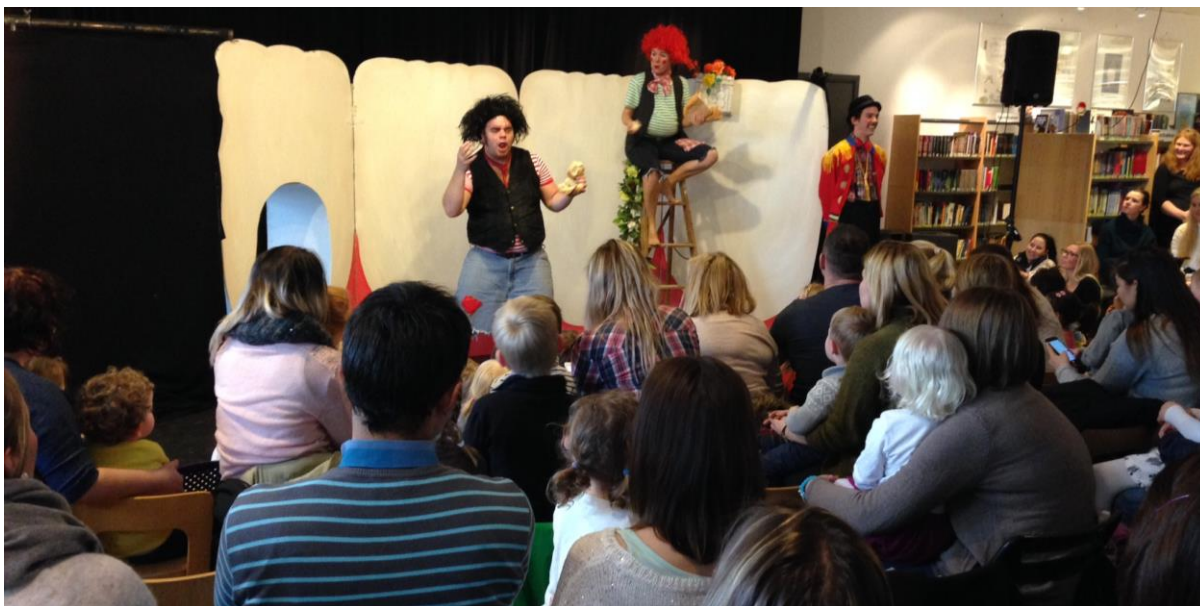
Karius og Baktus på besøk i Mjøndalen.